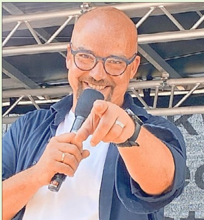
Moderator & DJ Adi Rückewold

Freitagabend heißt es sodann ab 21:00 Uhr „Back to the 80//90's!“ - für diesen Disco-Abend konnte der bekannte Radiomoderator Adi Rückewold gewonnen werden, der das Festzelt zum Beben bringen wird.