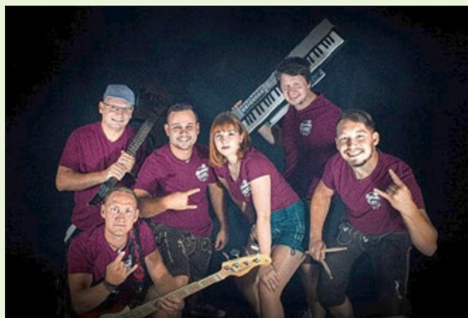
Partyband Rhöner Gaudi

Besonders freuen sich die Organisatoren darüber, dass am Samstag, 21. September 2024, ab 12:00 Uhr das traditionelle Backhausfest im Ortskern stattfinden wird. „Zwübbelsplotz“ und süße Leckereien werden die Gaumen der Besucher verwöhnen.